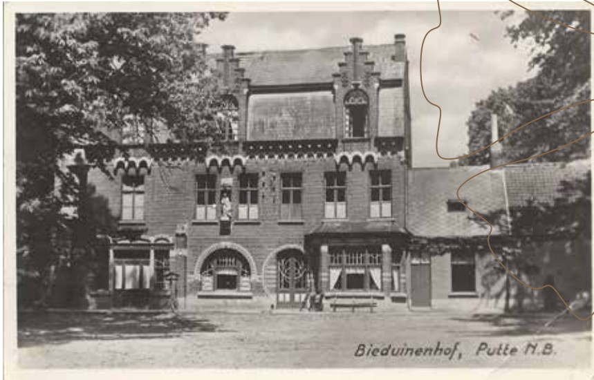
Bieduinenhof, rond 1910-1920