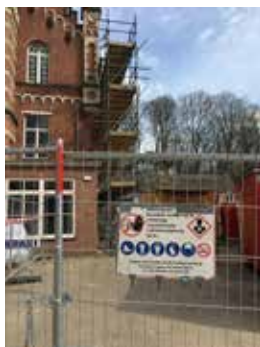
Keten- en kantorenpark + lunchruimte