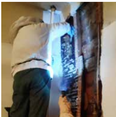
De raat is zo'n 70 cm breed en 2,5 m hoog!

Er bleek een reusachtig bijenhuis – een raat – in de muur te zitten. De raat was zeventig centimeter breed en tweeëneenhalve meter hoog! Henriëtte sneed de raat in stukken en zette alle stukken in een bijenkast. De kast bleef open. Als de bijenkoningin in de kast zit, komen de andere bijen er vanzelf naar toe. De volgende morgen deed Lukas de kast dicht. Henriëtte nam de bijenkast mee en laat het bijenvolk tot rust komen. Na drie weken 'logeren' komen de koningin en haar volk dan weer naar Titurel en krijgen ze een plekje bij het andere bijenvolk wat al op het landgoed woont.