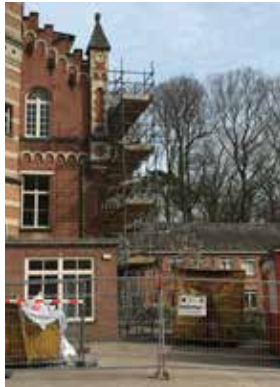
Hier wordt gewerkt!