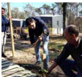
Samen bouwen we een fietsenstalling op de Cluse